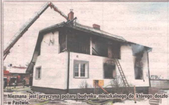
Nieznana jest przyczyna pożaru budynku mieszkalnego do którego doszło w Pastwie.

temperatur i lokalizacji zarzewi ognia przy użyciu kamery termowizyjnej. Następnego dnia prowadzone były działania mające na celu dogaszenie pogorzeliska - informuje mł. kpt. Krzysztof Skoczek, oficer prasowy Komendanta Powiatowego Państwowej Straży Pożarnej w Kwidzynie.