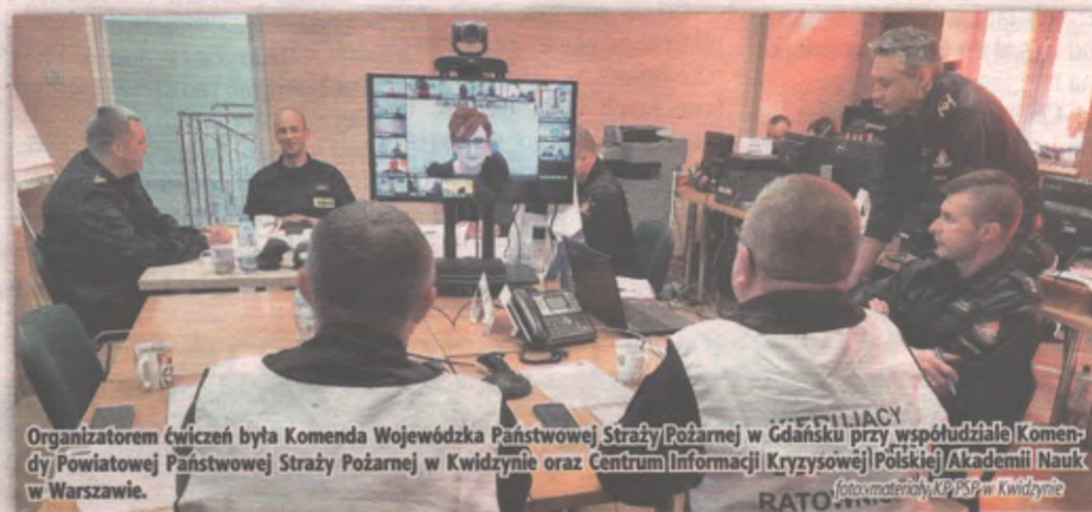
Organizatorem ćwiczeń była Komenda Wojewódzka Państwowej Straży Pożarnej w Gdańsku przy współudziale Komendy Powiatowej Państwowej Straży Pożarnej w Kwidzynie oraz Centrum Informacji Kryzysowej Polskiej Akademii Nauk w Warszawie.

pracowników z terenu zakładu, wyznaczenie stref niebezpiecznych, udzielenie pomocy osobom poszkodowanym, ostrzeżenie ludności o występowaniu zagrożenia czy zorganizowanie punktów przyjęcia sił i środków, uszczelnianie uszkodzonych zbiorników, ograniczanie stref skażenia, ewakuacja mieszkańców Bialek i Rozpędzin oraz