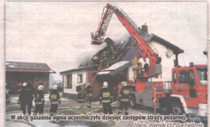
W akcji gaszenia ognia uczestniczyło dziesięć zastępów straży pożarnej.

- Działania strażaków polegały na zabezpieczeniu terenu akcji, udzieleniu kwalifikowanej pierwszej pomocy osobie poszkodowanej i przekazaniu jej zespołowi ratownictwa medycznego. Podano pięć prądów gaśniczych wody, którą pobierano z pobliskiego stawu. Strażacy ewakuowali mienie i rozebrali elementy konstrukcyjne budynku. Kolejne działania to oddymianie pomieszczeń oraz sprawdzenie rozkładu