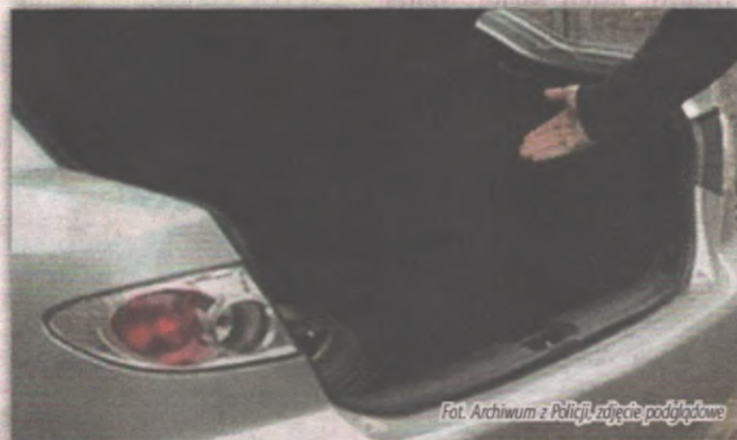
zdjęcie podglądowe

Wstępnie ustalono, że przyczyną całego zdarzenia były