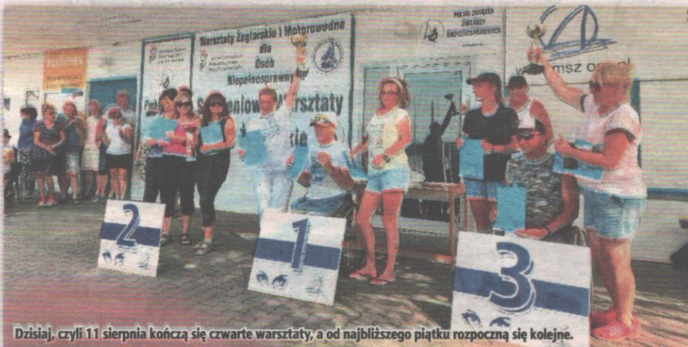
Dzisiaj, czyli 11 sierpnia kończą się czwarte warsztaty, a od najbliższego piątku rozpoczną się kolejne.