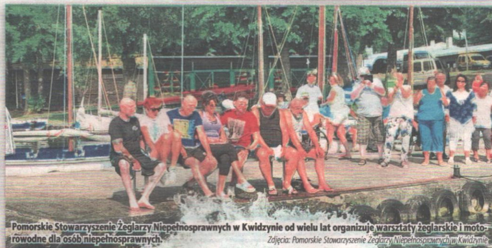
Pomorskie Stowarzyszenie Żeglarzy Niepełnosprawnych w Kwidzynie od wielu lat organizuje warsztaty żeglarskie i motorowodne dla osób niepełnosprawnych.