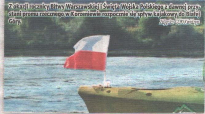
Z okazji rocznicy Bitwy Warszawskiej i Święta Wojska Polskiego z dawnej przystani promu rzecznej w Korzeniewie rozpocznie się spływ kajakowy do Białej Góry.

na przedstawienie jest bezpłatny. GOK zachęca do zabrania kocyków do siedzenia. (op)