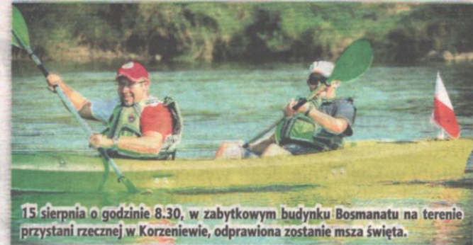
15 sierpnia o godzinie 8.30, w zabytkowym budynku Bosmanatu na terenie przystani rzecznej w Korzeniewie, odprawiona zostanie msza święta.

GOK przygotował również propozycję dla rodzin z dziećmi. Na placu zabaw w pobliżu przedszkola w Korzeniewie o godzinie 16.00 rozpocznie się przedstawienie „Kurczaczek jedynaczek” w wykonaniu Teatru Łątka z Łodzi. Po spektaklu dla najmłodszych odbędą się krótkie warsztaty animacyjne dla najmłodszych widzów. Wstęp