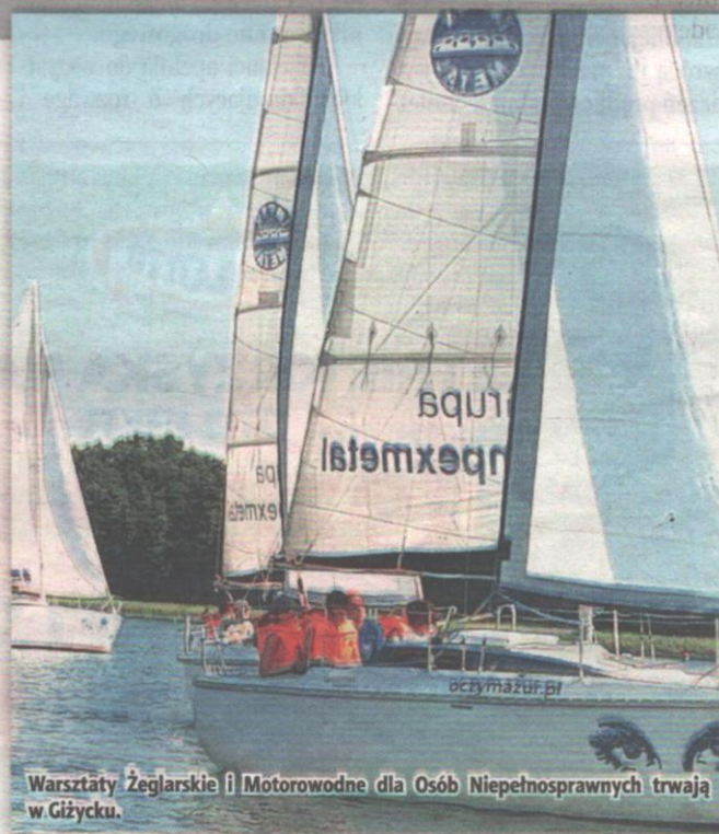
Warsztaty Żeglarskie i Motorowodne dla Osób Niepełnosprawnych trwają w Giżycku.

Wartość realizowanego projektu to ponad 696 tys. zł, w tym dofinansowanie z PFRON wynosi ponad 626 tys. zł. Piąte warsztaty odbędą się w dniach od 13 do 26 sierpnia, natomiast szóste od 21 września do 4 października. Warsztaty są bezpłatne. (jk)