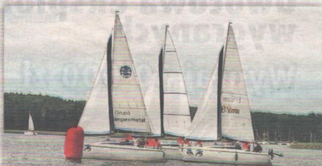
Uczestnikami warsztaty są niepełnosprawne, które przyjechały do Giżycka z całego kraju.

- Warsztaty organizujemy w Międzynarodowym Centrum Żeglarstwa i Turystyki Wodnej w Giżycku. Odbły się już trzecie z sześciu zaplanowanych w tym sezonie letnim szkoleń żeglarskich i motorowodnych dla osób niepełnosprawnych dofinansowane przez Państwowy Fundusz Rehabilitacji Osób Niepełnosprawnych. W warsztatach wzięło udział 24 uczestników, którzy przyjechali z różnych regionów Polski. Warunki pogodowe były bardzo dobre. Przez cały czas trwania warsz-