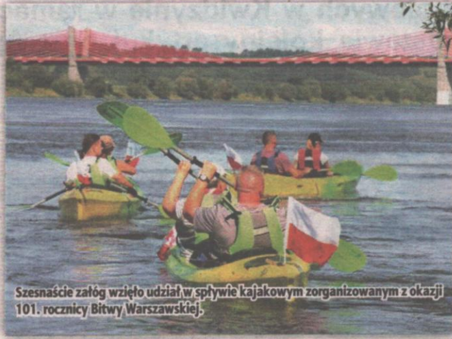
Szesnaście załóg wzięło udział w spływie kajakowym zorganizowanym z okazji 101. rocznicy Bitwy Warszawskiej.

- Nie tylko dla katolików, przez to, że mogą wspominać Wniebowzięcie Najświętszej Maryi Panny, ale dla wszystkich Polaków, zarówno wierzących jak i niewierzących. My się gromadzimy w tym miejscu, aby dziękować Panu Bogu za Maryję, która w sposób wyjątkowy czuwa nad naszym narodem, która przez nasz naród została wybrana na Królową, i która w tych najtrudniejszych okresach była zawsze z nami. Tak jak to było i w 1920 roku kiedy wydawało się, że wojsko polskie jest skazane na porażkę, a nasz kraj