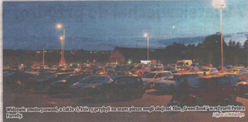
Widzowie zmotoryzowani, a także ci, którzy przybyli na seans pieszo mogli obejrzeć film „Green Book” w reżyserii Petera Farrelly.

- Parking przy Kwidzyńskim Parku Technologicznym pomieścił około 200 samochodów. Spora część widzów wybrała