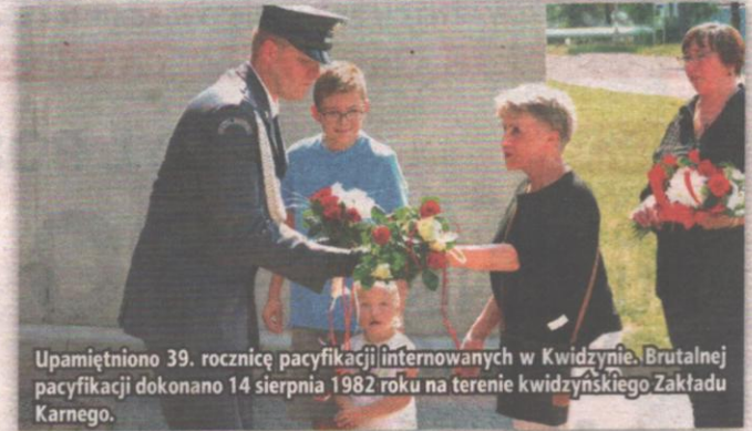
Upamiętniono 39. rocznicę pacyfikacji internowanych w Kwidzynie. Brutalnej pacyfikacji dokonano 14 sierpnia 1982 roku na terenie kwidzyńskiego Zakładu Karnego.

Obecnie przy bramie znajduje się tablica upamiętniająca tamte wydarzenia. Zdaniem internowanych kwidzyński obóz należał do najcięższych w kraju. Przebywało w nim około 300 osób. Podczas brutalnego ataku na internowanych pobitych zostało ok. 100 działaczy Solidarności. Dziewięciu z nich trafiło do szpitala. Niektórzy skutki pobicia odczuwali przez wiele lat. Sprawcy nigdy nie