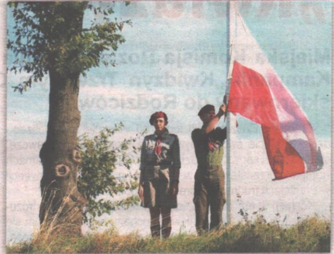
Po mszy uroczyste wciągnięto na maszt flagę Polski.

GOK przygotował również propozycję dla rodzin z dziećmi. Teatr Łątka z Łodzi wystawił przedstawienie „Kurczaczek Jedyńcazek”. To pouczająca bajka o niebezpieczeństwach jakie czyhały na małego kurczaczka, była drugą propozycją