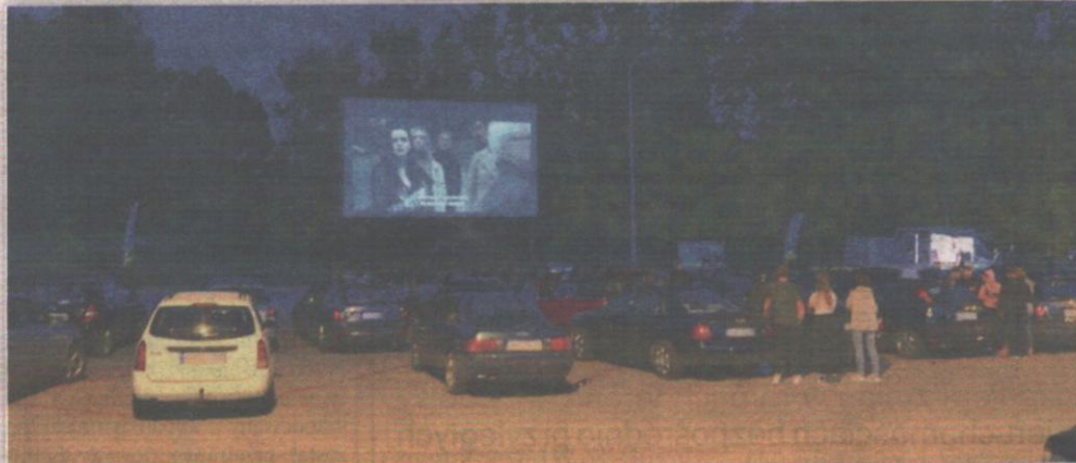
Na pierwszy seans filmowy do KinoParku, czyli hybrydowego kina plenerowego w Górkach, przyjechało prawie 200 aut.

sierpnia na ekranie w KinoParku będzie można obejrzeć komedię kryminalną „Babcia Gandzia”. (jk)