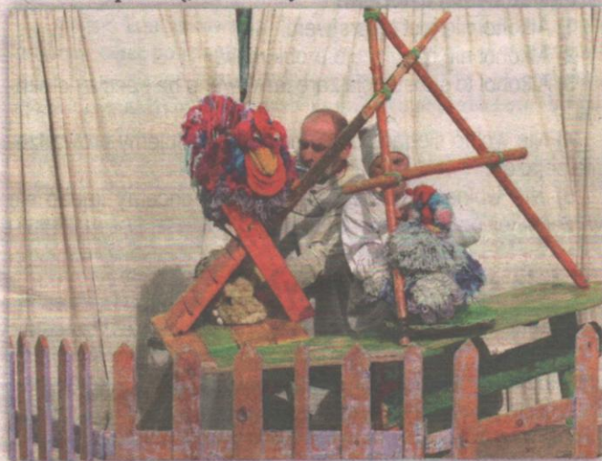
GOK przygotował również propozycję dla rodzin z dziećmi. Teatr Łątka z Łodzi wystawił przedstawienie „Kurczaczek Jedyńcazek”.

w ramach cyklu przedstawień zowanych przez Gminny Ośrodek Kultury w Kwidzynie. (op)