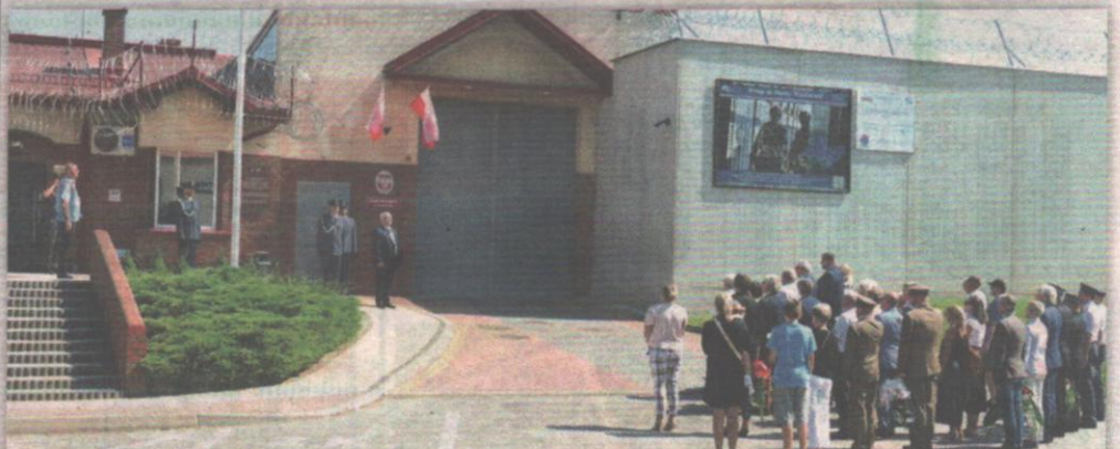
Brutalnej pacyfikacji dokonano 14 sierpnia 1982 roku na terenie kwidzyńskiego Zakładu Karnego. Obecnie przy bramie znajduje się tablica upamiętniająca tamte wydarzenia.