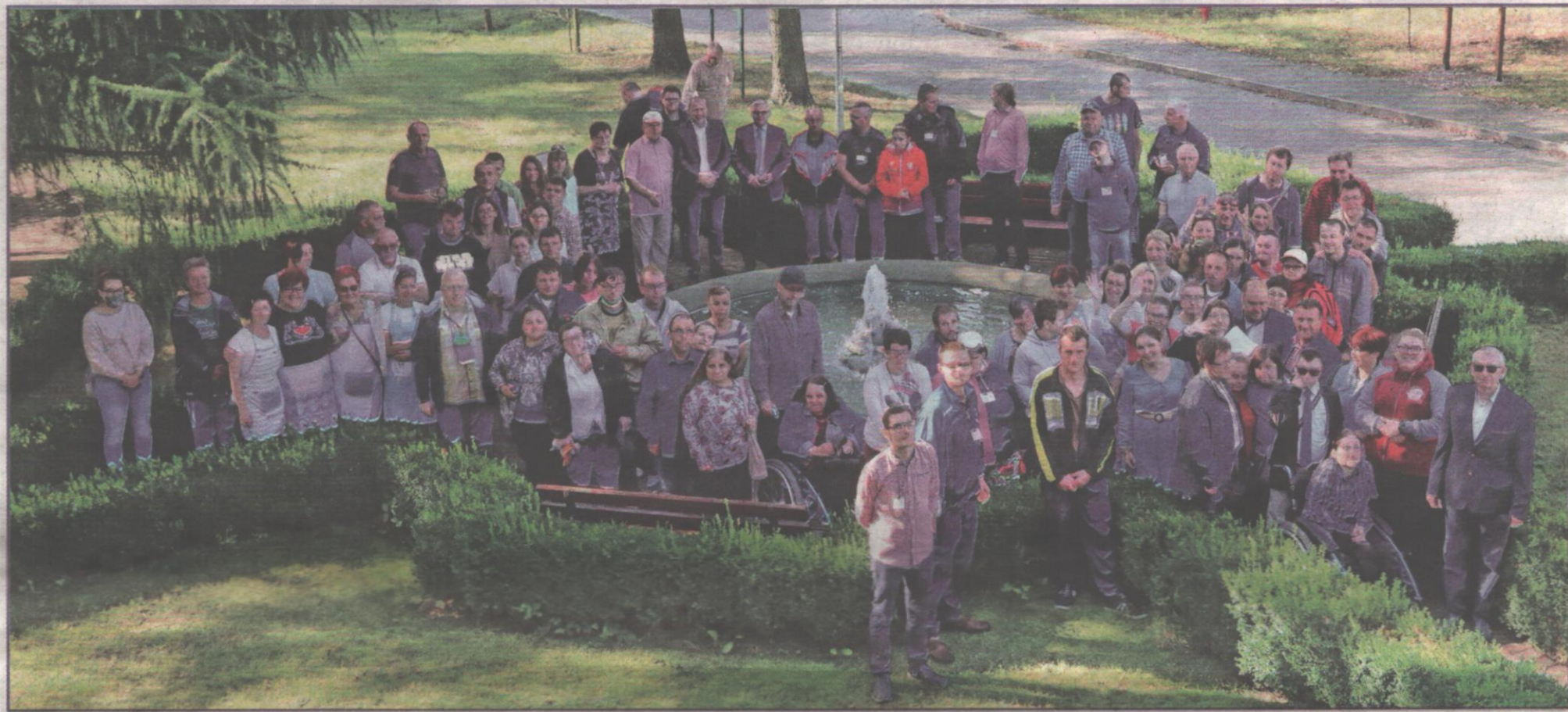
Kształtowanie wiedzy z zakresu naturalnych sposobów dbania o zdrowie, zachęcanie do szczepień przeciwko COVID-19, a także profilaktyka związana między innymi z zagrożeniem jakim jest koronawirus, to tematy, które pojawiły się podczas plenerowej imprezy zorganizowanej przez Warsztat Terapii Zajęciowej, prowadzony przez Fundację „Misericordia” w Górkach (gmina Kwidzyn). Na zdjęciu uczestnicy, organizatorzy i zaproszeni goście.

Kształtowanie wiedzy z zakresu naturalnych sposobów dbania o zdrowie, zachęcanie do szczepień przeciwko COVID-19, a także profilaktyka związana między innymi z zagrożeniem jakim jest koronawirus, to tematy, które pojawiły się podczas plenerowej imprezy zorganizowanej przez Warsztat Terapii Zajęciowej, prowadzony przez Fundację „Misericordia” w Górkach (gmina Kwidzyn). Spotkanie zorganizowano w ramach projektu „Szlachetne zdrowie...” dofinansowanego przez samorząd powiatu kwidzyńskiego w ramach konkursu „Wspieranie działań w zakresie integracji oraz szeroko rozumianej rehabilitacji zmierzających do ograniczenia skutków niepełnosprawności”.