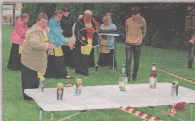
(jk) Podczas „Święta piezzonego ziemniaka” nie zabrakło różnych konkursów.

wszystkich uczestników święta. TKLN „Ojczyzna” powstało w 1992 roku. Stowarzyszenie co roku organizuje różnego rodzaju przedsięwzięcia dla mieszkańców powiatu kwidzyńskiego. Nie skupia jedynie osób pochodzenia niemieckiego, ale także osoby które są zainteresowane poznawaniem języka i kultury niemieckiej. Towarzystwo zajmuje się również działalnością charytatywną.