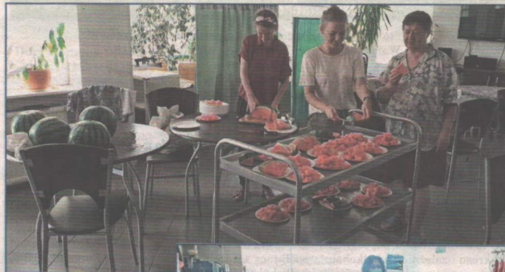
Mieszkańcy domu obchodzili Dzień Arbuza. Na zdjęciu u góry: przygotowania do poczęstunku i pierwsza degustacja.