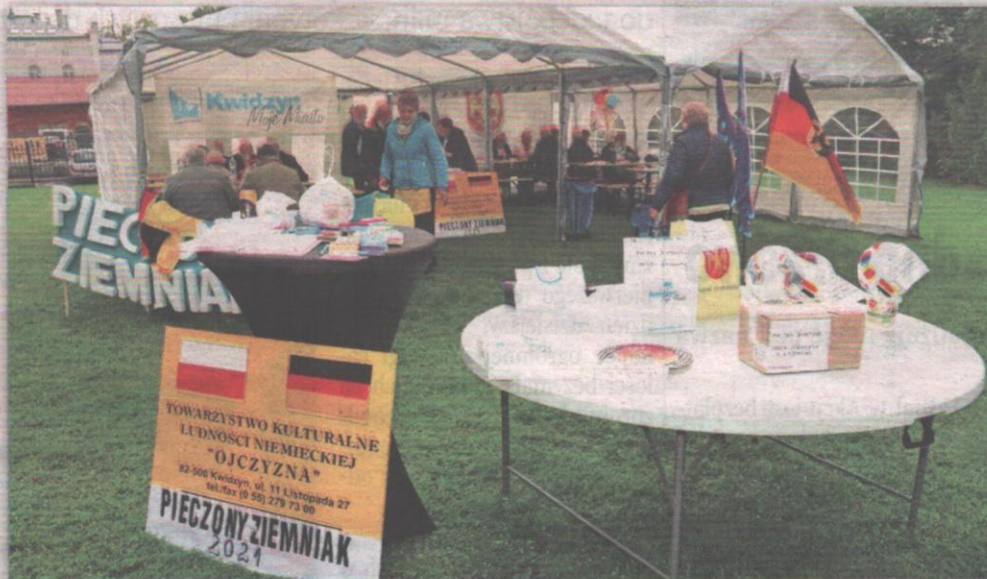
Członkowie i sympatycy Towarzystwa Kulturalnego Ludności Niemieckiej „Ojczyzna” spotkali się podczas „Święta Piezzonego Ziemniaka” w Kwidzynie.