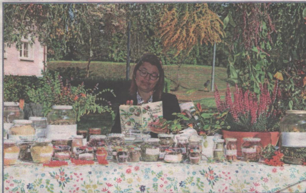
Przy zabytkowym dworku w Górkach przygotowano stoisko z ziołami.