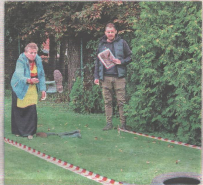
Rzut kaloszem to jedna z konkurencji która bawiła uczestników spotkania.