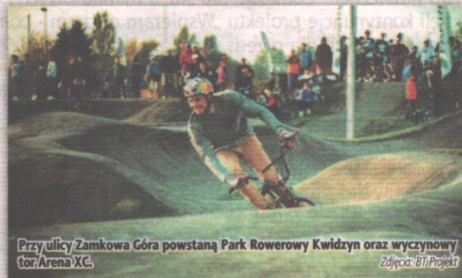
Przy ulicy Zamkowa Góra powstanie Park Rowerowy Kwidzyn oraz wyczynowy tor Arena XC.

W ramach Parku Rowerowego Kwidzyn powstanie asfaltowy tor rowerowy typu pumptrack o długości ok. 200 metrów. Ma to być profesjonalna konstrukcja składająca się z specjalnie wyprofilowanych zakrętów oraz muld, pokryty jest szybką i równą warstwą specjalnego asfaltu. Według autorów z toru będą mogli korzystać zarówno dzieci, jak i dorośli. Pumptrack będzie dostępny dla wszystkich miłoś-