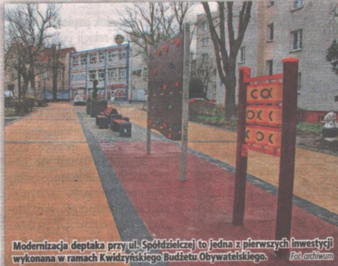
Modernizacja deptaka przy ul. Spółdzielczej to jedna z pierwszych inwestycji wykonana w ramach Kwidzyńskiego Budżetu Obywatelskiego.

Pierwszy z wybranych przez mieszkańców miasta projektów to butelkomat, który miałby zostać ustawiony na ulicy Słowackiego przy placu po byłym Manhattanie. Automat ma przyjmować plastikowe butelki PET, puszki i nakrętki plastikowe. W zamian za wrzucenie butelki urządzenie będzie mogło wydawać bony do wykorzystania jako zniżki do kina, teatru, basenu, kawiarni. Urządzenie ma być wyposażone w ekran LED z hartowanym szkłem antyodblaskowym, który za-