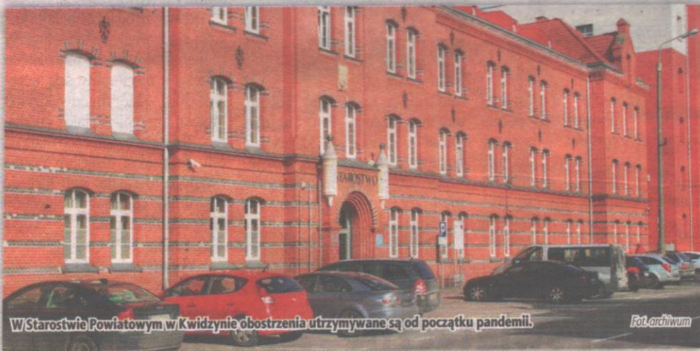
W Starostwie Powiatowym w Kwidzynie obostrzenia utrzymywane są od początku pandemii.

POWIAT. Coraz częściej zarząd powiatu podejmuje uchwały w sprawie wyrażenia zgody na częściowe zawieszenie zajęć w trybie stacjonarnym w szkołach średnich. Jerzy Godzik, starosta kwidzyński, uważa, że sytuacji nie da się opanować bez podjęcia zdecydowanych działań, które obejmą szczepieniami wszystkich.