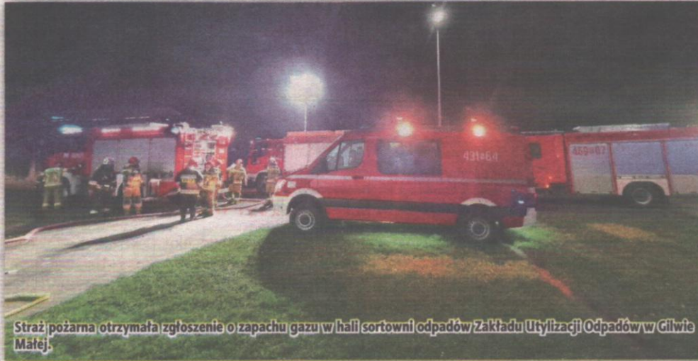
Straż pożarna otrzymała zgłoszenie o zapachu gazu w hali sortowni odpadów Zakładu Utylizacji Odpadów w Gilwie Małej.

POWIAT. Straż Pożarna otrzymała zgłoszenie o zapachu gazu w hali sortowni odpadów Zakładu Utylizacji Odpadów w Gilwie Małej. Do zdarzenia zadysponowane zostały Specjalistyczne Grupy Ratownictwa Chemiczno-Ekologicznego Kwidzyn oraz Gdynia, a także jeden zastęp z OSP Prabuty. Na miejsce przybył także patrol policji.