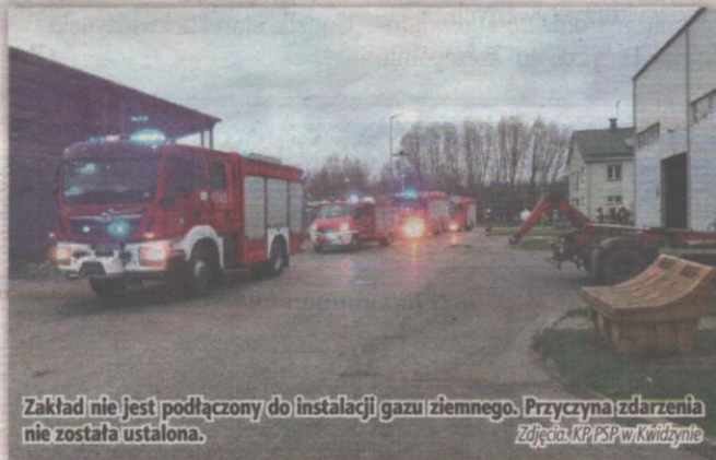
Zakład nie jest podłączony do instalacji gazu ziemnego. Przyczyna zdarzenia nie została ustalona.