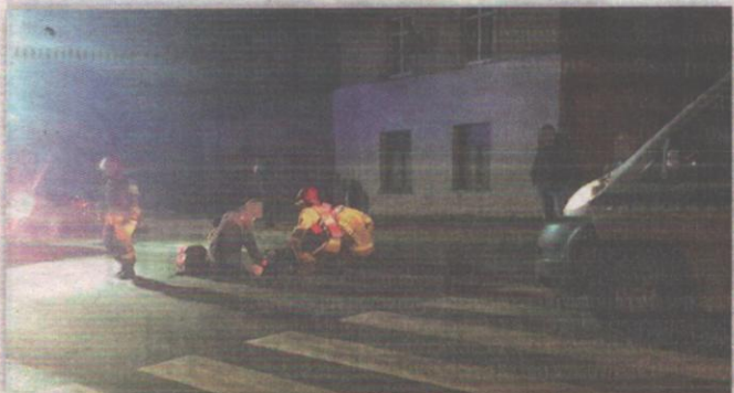
red. tech. BR

ZMIANY WCHODZĄ W ŻYCIE Z DNIEM 1 GRUDNIA 2021 R.