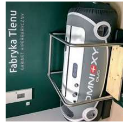
Fabryka Tłenu Instytut Nowoczesnej Medycyny

Pierwsze urządzenie, które było pierwowzorem dla późniejszych komór hiperbarycznych, zostało zaprojektowane jeszcze w XVII wieku. Zapożyczkowiło leczenie chorób płuc sprężonym powietrzem. Do szerszego użycia komory zaczęły wchodzić w XIX wieku. Teraz, taka współczesna kapsuła dostępna jest także w Kwidzynie.