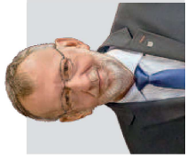
Andrzej Krzysztofak, Burmistrz Kwidzyna

W niniejszym roku, głównie ze względu na pandemię, burmistrz Kwidzyna umorzył podatek od nieruchomości, co wyniosło prawie 33 000 zł, a trzem osobom płatność tego podatku odroczone lub rozłożono na raty. Pomoc w tym zakresie wyniosła łącznie 93 000 zł.