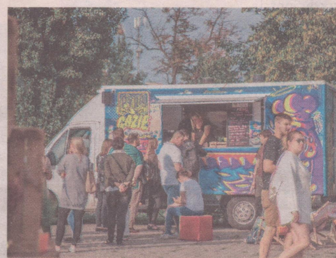
Na smakoszy będą czekać przysmaki z różnych stron świata.

dzie mógł zagłosować na swojego faworyta. Wstęp na fe-