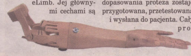
Proteza TrueLimb jest wykonana przy użyciu druku 3D.