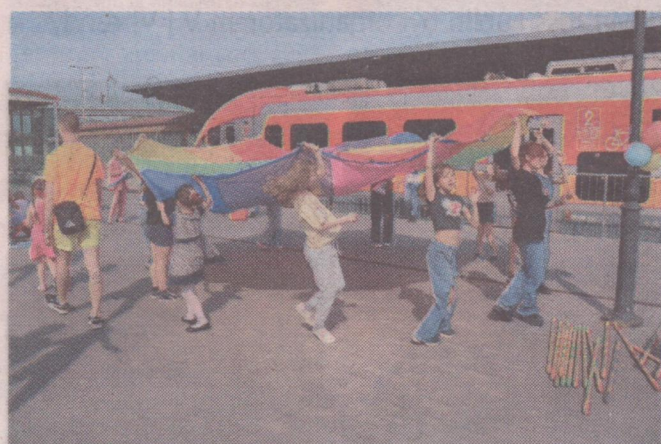
Gry i zabawy, konkursy z nagrodami, to tylko niektóre z punktów, które wypełniły bogaty program pikniku polsko-ukraińskiego „Mosty przyjaźni” przygotowanego w Bibliotece Miejsko-Powiatowej.

POWIAT. Gry i zabawy, konkursy z nagrodami, warsztaty „Zrób i zabierz do domu” to tylko niektóre z punktów, które wypełniły bogaty program pikniku polsko-ukraińskiego „Mosty przyjaźni” przygotowanego w Bibliotece Miejsko-Powiatowej.