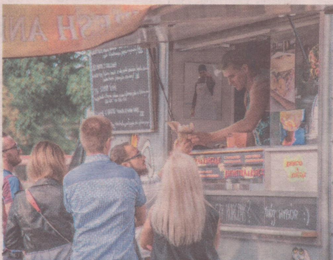
Do Kwidzyna przyjadą mobilne restauracje z całej Polski.

Zaplanowano także grę terenową. Dla zwycięzców organizatorzy przygotowali nagrody: bony na dania z food trucków oraz festiwalowe gadżety. Przedstawiciele mobilnych restauracji zaważają o tytuł Najsmaczniejszego Food Trucka. Każdy bę-