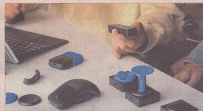
Akcesoria adaptacyjne Microsoft.

Aby ułatwić osobom niepełnosprawnym pracę przy komputerze, Microsoft stworzył zestaw odpowiednio dostosowanych akcesoriów. Akcesoria te to bezprzewodowa mysz z dostępną osobno podstawką, pad ośmiokierunkowy, joystick i podwójny przycisk. Współpracują one z koncentratorem, który umożliwia połączenie z komputerem trzech urządzeń przewodowo przy użyciu portu USB typu C lub bezprzewodowo przy użyciu Bluetooth. Koncentrator ten jest wyposażony również w 5 gniazd Jack 3,5 mm, które umożliwiają podłączenie wyprodukowanych przez inne firmy akcesoriów wspomagających takich jak przyciski i przełączniki. Akcesoria mają funkcję tworzenia makr umożliwiających łatwe wykonane określonych sekwencji akcji. Mogą zostać także dodatkowo