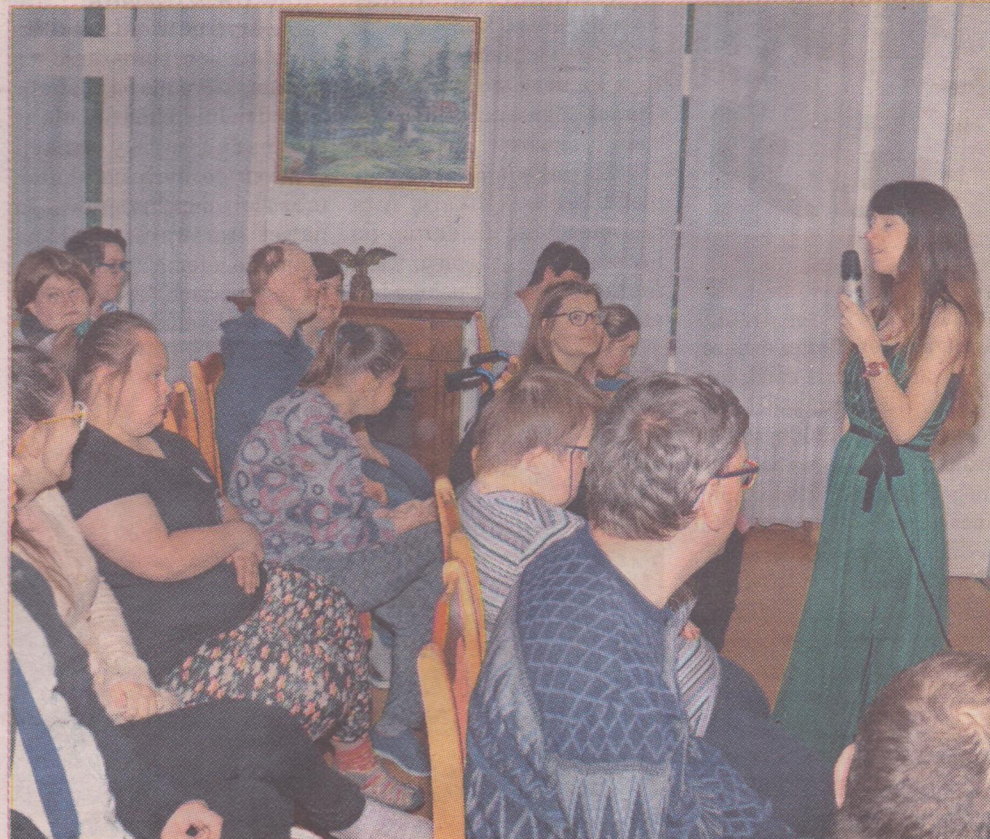
Podczas koncertu wykonawcy zaprezentowali między innymi swoje autorskie utwory.