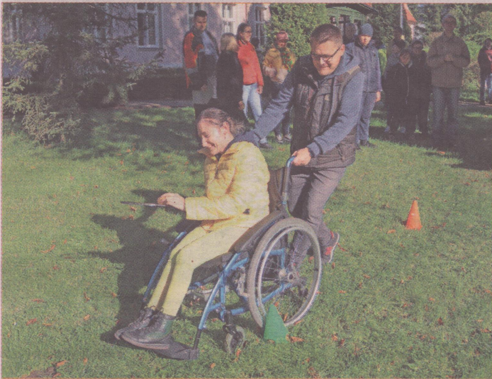
Trzy organizacje pozarządowe zrealizują projekty, których adresatem są niepełnosprawni mieszkańcy powiatu kwidzyńskiego.

Organizacje pozarządowe zrealizują projekty, których adresatem są niepełnosprawni mieszkańcy powiatu kwidzyńskiego. Projekty do dofinansowania zostały wybrane w drodze konkursu, przeprowadzonego przez samorząd powiatu kwidzyńskiego, dotyczącego wspierania działań w zakresie integracji oraz szeroko rozumianej rehabilitacji, zmierzających do ograniczenia skutków niepełnosprawności.