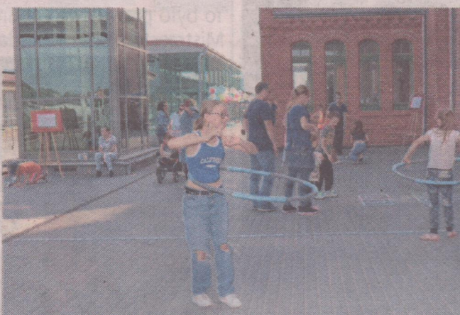
Było kręcenie hula hop