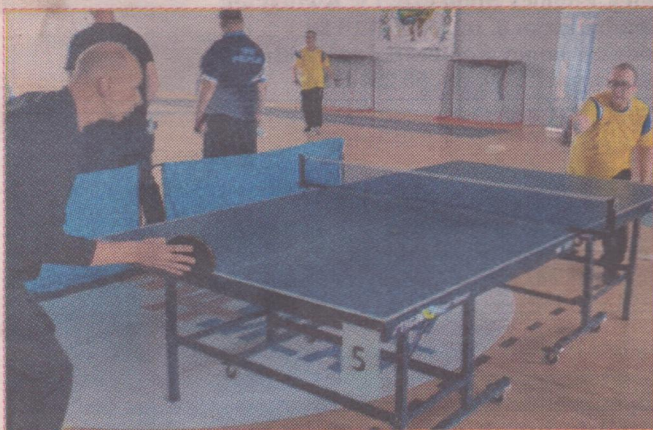
W zawodach wzięło udział ok. 60 niepełnosprawnych tenisistów. Turniej odbył się w sali gimnastycznej Zespołu Kształcenia i Wychowania nr 1 w Pelplinie. To kolejne w tym roku zawody rozgrywane w ramach Kociewsko-Powisłańskich Potyczek Ping-pongowych.

DPS Rudno, DPS Ryjewo, Pelplin, SDS Gniew i WTZ Ryjewo. DPS Starogard Gdański, DPS Szpęgawsk, SOSW (op)