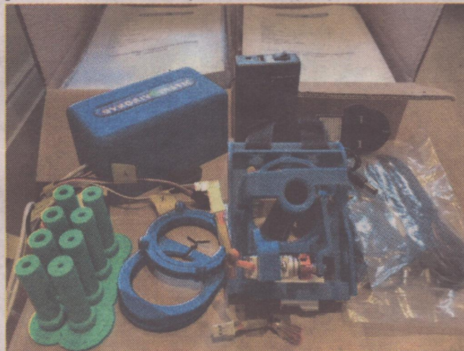
Eyedrivomatic to system, który umożliwia sterowanie elektrycznym wózkiem inwalidzkim przy użyciu ruchu oczu.