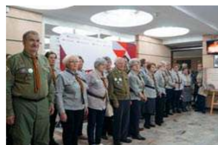
4.11 - W Kinoteatrze Jubileusz 50-lecia istnienia obchodzili członkowie Kręgu Seniorów ZHP „Promienie”.