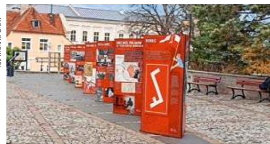
11.11 Na placu przed Kinoteatrem nastąpiło otwarcie wystawy plenerowej „Jesteśmy Polakami”.