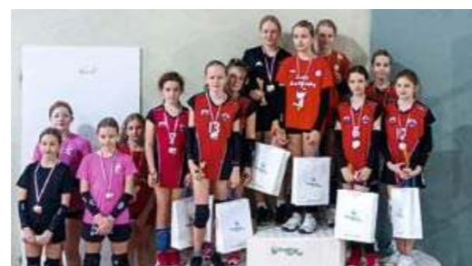
11.11 Z okazji Święta Niepodległości KCSiR zorganizował dla młodzieży turniej piłki siatkowej.