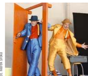
25.11 W ramach Dobranoczek Teatralnych widzowie mogli obejrzeć spektakl „Paweł i Gawel”.