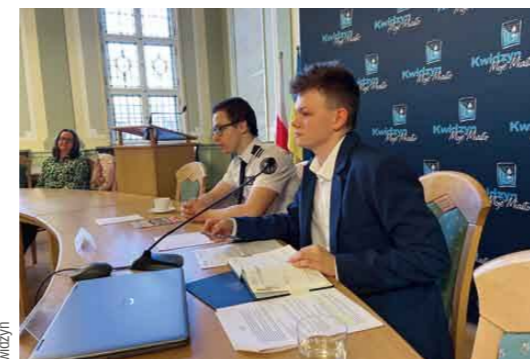
▲ 28.02 - Obrady Młodzieżowej Rady Miejskiej