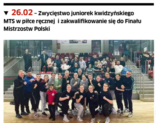
▼ 26.02 - Zwycięstwo juniork kwidzynieńskiego MTS w piłce ręcznej i zakwalifikowanie się do Finału Mistrzostw Polski