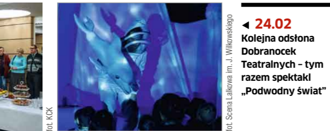
◀ 24.02 Kolejna odsłona Dobranoczek Teatralnych - tym razem spektakl „Podwodny świat”