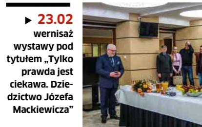
▶ 23.02 wernisaż wystawy pod tytułem „Tylko prawda jest ciekawa. Dzieiectwo Józefa Mackiewiczza”