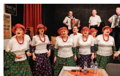
◀ 17.02 - Pierwsze z cyklu spotkań „Poznajmy się bliżej”