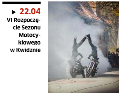
▶ 22.04 VI Rozpoczęcie Sezonu Motocyklowego w Kwidzynie