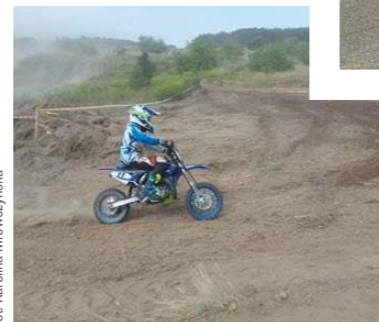
◀ 22-23.04 Wyścigi cross-country