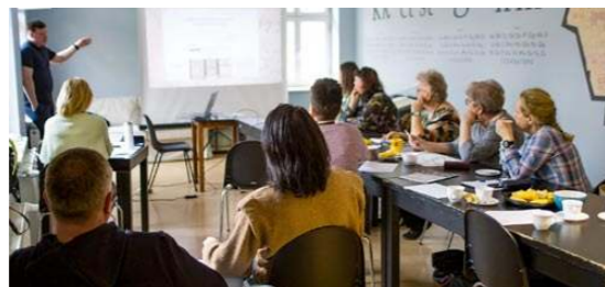
◀ 15.04 Warsztaty genealogiczne