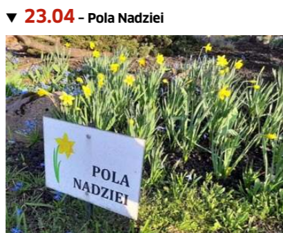
▼ 23.04 - Pola Nadziei