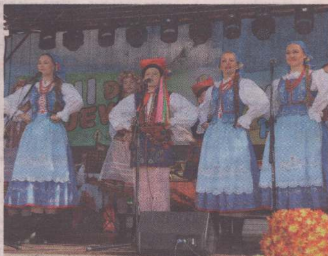
Dwudzieste drugie powiatowe święto plonów odbędzie się w tym roku. Gospodarzem tegorocznych Dożynek Powiatowych będzie samorząd gminy Gardreja.

Dożynki powiatowe są otwartą imprezą kulturalną dla wszystkich mieszkańców powiatu kwidzińskiego, nawiązującą do tradycji ludowej. Według samorządu powiatu impreza pełni ważną rolę w promowaniu powiatu w regionie. Co roku organizację imprezy samorząd powiatu powierza innej gminie. Oprócz części oficjalnej odbędą się występy artystyczne. Nie zabraknie także różnego rodzaju konkursów i zawodów rekreacyjno-sportowych. Nie powinno też zabraknąć tradycyjnego już konkursu wieńców dożynkowych. Samorząd powiatu przekaze gminie Gardreja na organizację imprezy dotację celo-