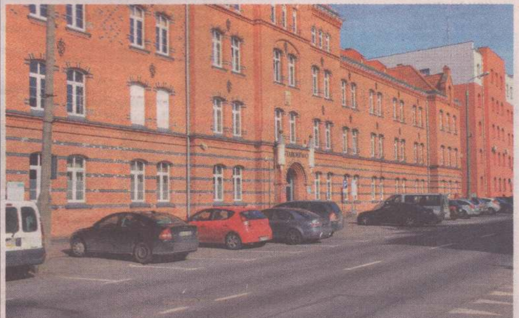
Zakończono modernizację oświetlenia w budynku Starostwa Powiatowego w Kwidzynie.

POWIAT. Zakończono modernizację oświetlenia w budynku Starostwa Powiatowego w Kwidzynie. W pomieszczeniach pojawiły się nowe, energooszczędne lampy. Inwestycja pozwoli na zmniejszenie kosztów związanych z utrzymaniem starostwa.