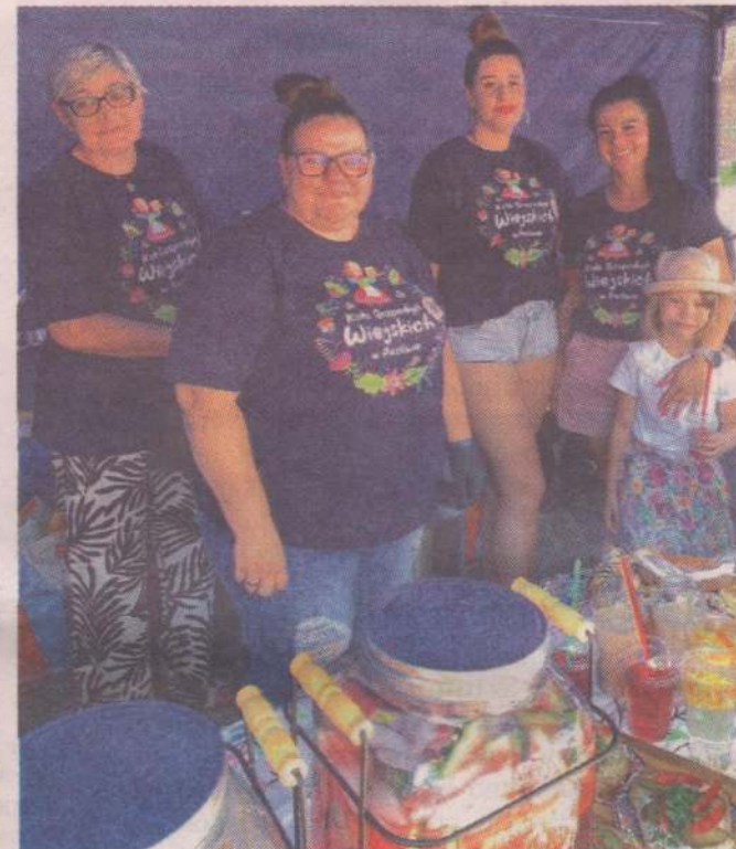
Organizatorem letniego pikniku było Koło Gospodyń Wiejskich w Pastwie.