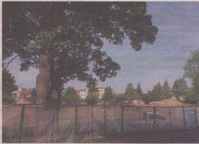
Dodatkowe prace zostaną wykonane w związku z przebudową obiektów sportowych przy Zespole Szkół Ogólnokształcących nr 1 w Kwidzynie. Powodem niestabilny grunt, który trzeba wymienić pod budowanymi obiektami.

W ramach inwestycji powstaną boiska do koszykówki i piłki ręcznej, bieżnia, skocznia w dal i do trójskoku oraz stanowiska do pchnięcia kulą. Powstaną też trybuny z możliwością ich demontowania. Z uwagi na roboty dodatkowe limit wydatków i zobowiązań na