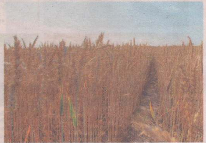
Samo oszacowanie szkód przez komisję nie pozwoli na wygenerowanie protokołów. Konieczne jest zgłoszenie w aplikacji.

Zaznaczyć należy, że wniosek złożony o oszacowanie szkód tylko przez komisję gminną nie pozwoli na otrzymanie wsparcia – rolnik musi złożyć wniosek w aplikacji, by wygenerować protokół oszacowania szkód. Komisja powołana przez Wojewodę będzie przekazywać rolnikowi jedynie raport oszacowania szkód, który bez protokołu